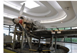
知覧特攻平和会館