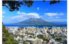
展望台からの眺望