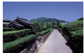
知覧武家屋敷散策