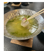
カンパチの知覧茶 しゃぶしゃぶ